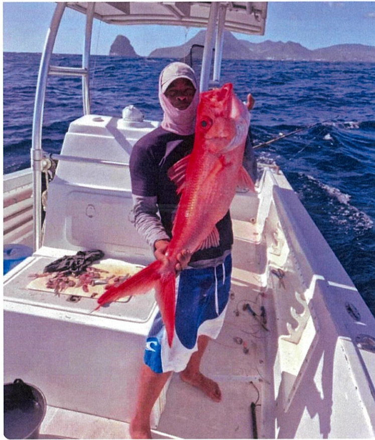
Au retour d'une pêche fructueuse.